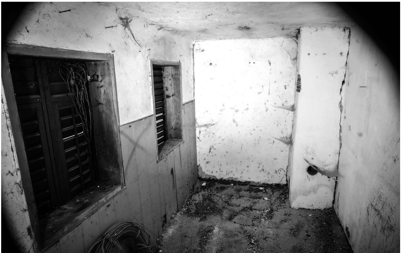
Breaking Bad in Hallstatt - Die Produktionsstätte wurde vom Moment-Team ausfindig gemacht

wirklich die Produktionsstätte, in welcher „ein ölfreier Kompressor die Druckluft in Dosen presst“. Für die Luftherstellung wurden sogar extra Maschinen angefertigt – so viel zu „Hand abgefüllt“. Durch ein Loch in der Hüttenür erhascht man einen Blick in die Produktionsstätte. Von hochwertiger Luft-Industrie-Anlage und UNESCO-Flair fehlt jede Spur.