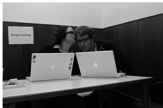
derMoment der Liebe (2010)