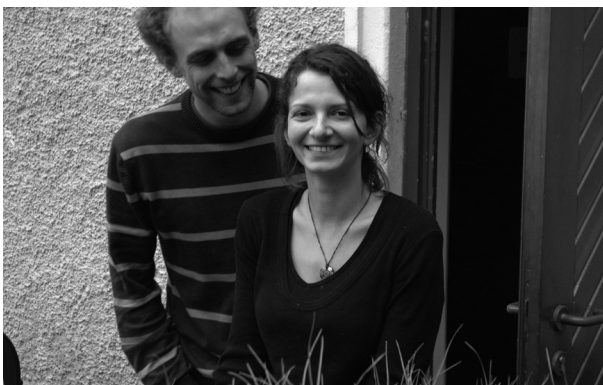
Liebe auf dem ersten Moment (2008)

Crew hier mitlesen: Spätestens am Samstag um 00:00 muss es wieder Di-di-di-di-dii-dii-dii-di-didididiiii durch Hallstatt schallen.