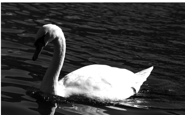
KeineR liebt den Schwan (nie)