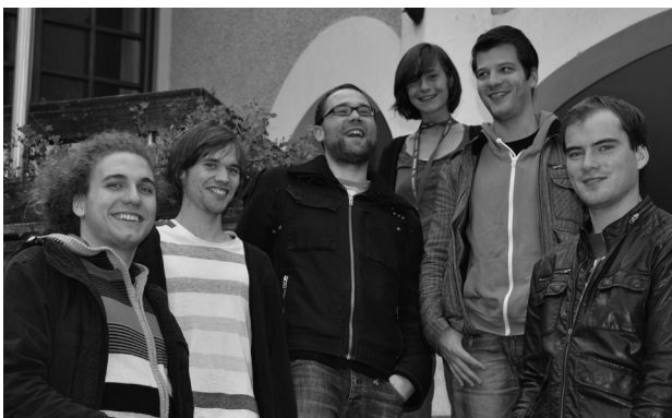
War 2010 das ORG-Team: diese netten, jungen Menschen