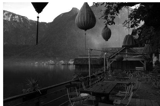
War schon immer schön: Hallstatt