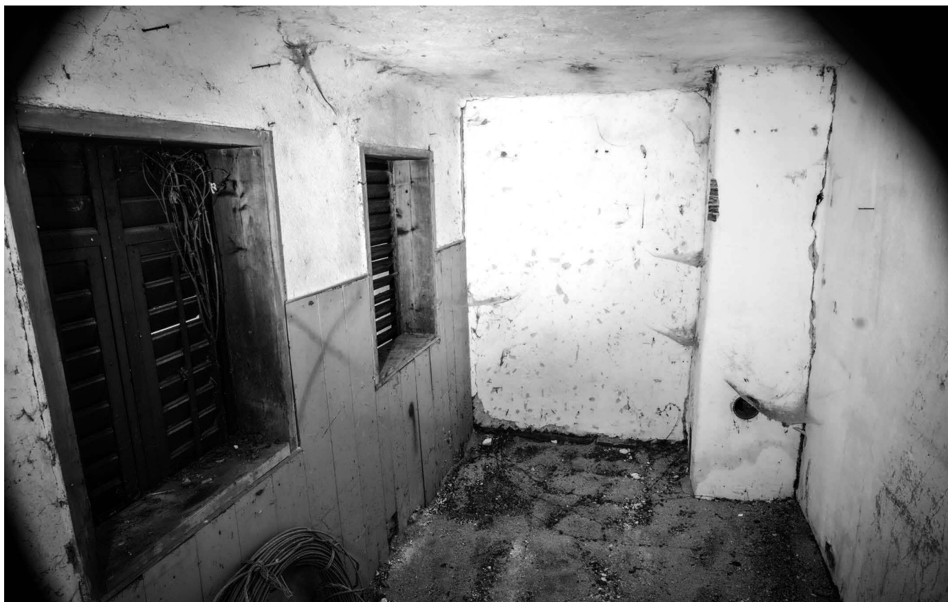
Breaking Bad in Hallstatt - Die Produktionsstätte wurde vom Moment-Team ausfindig gemacht

wirklich die Produktionsstätte, in welcher „ein ölfreier Kompressor die Druckluft in Dosen presst“. Für die Luftherstellung wurden sogar extra Maschinen angefertigt – so viel zu „Hand abgefüllt“. Durch ein Loch in der Hüttenür erhascht man einen Blick in die Produktionsstätte. Von hochwertiger Luft-Industrie-Anlage und UNESCO-Flair fehlt jede Spur.